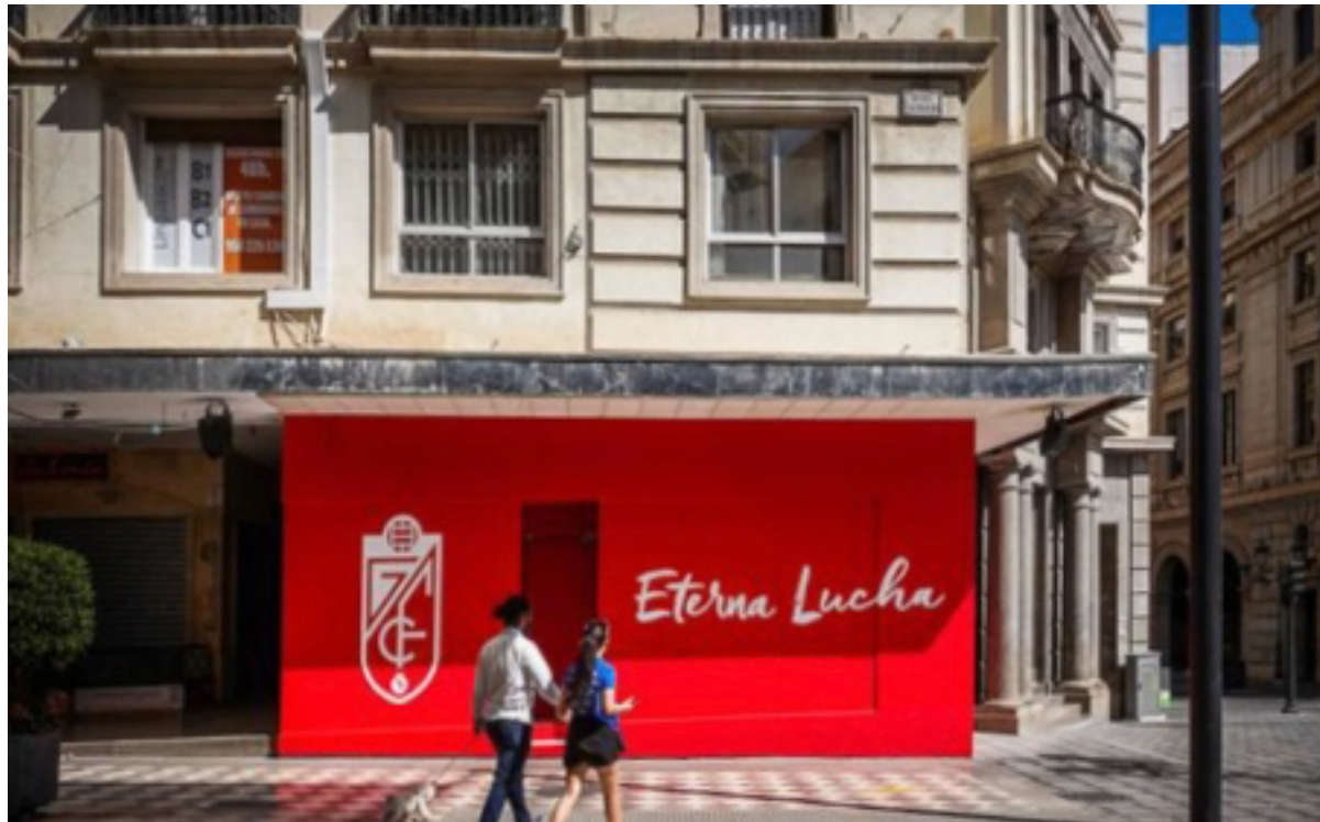
Nueva tienda oficial, situada en pleno centro de Granada.

la segunda fase de la Ciudad Deportiva del GCF, paradas desde la colocación solemne de la primera piedra, allá por 2016. Son