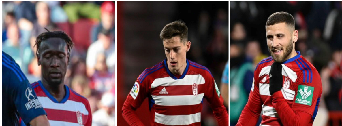
En el mercado invernal vinieron: Diedhiou, Pol Lozano y Weissman.

procedente del Cádiz, de 31 años, atacante de banda o media punta, jugador de gran clase pero muy intermitente, utilizado en un total de 23 encuentros entre liga y copa, casi siempre saliendo desde el banquillo en los últimos minutos de cada partido.