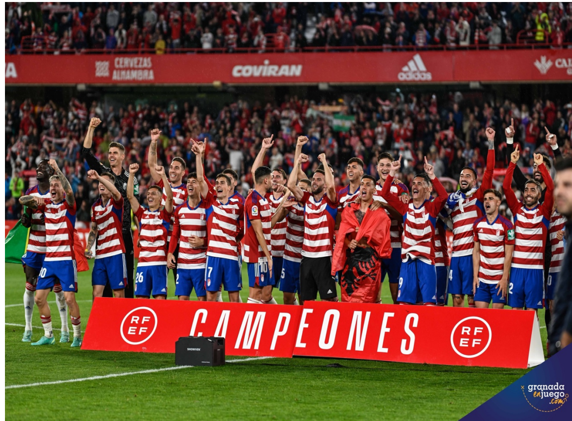
Celebración en el Nuevo Los Cármenes por el ascenso tras vencer al Leganés.